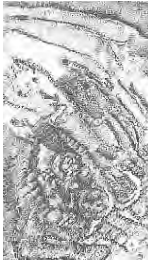
Michaux, pintura mescalínica, 1957. Oleo sobre tela. 33 x 19 cm.

Más débil aún, la mescalina hace ondular todas las cosas [...]» 12