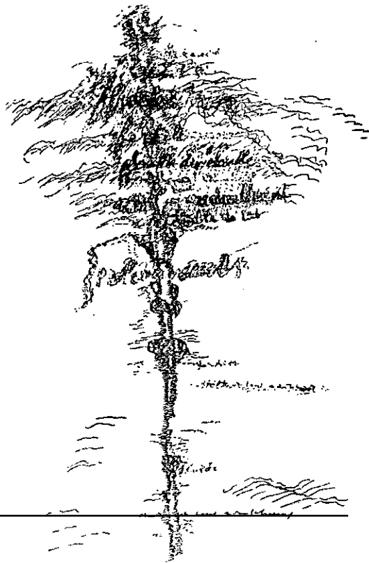
Michaux, dibujo mescalínico, c. 1956-1958. Tinta sobre papel. 21 x 17 cm.

«[...] los encabalgamientos, fenómeno siempre presente en la Mescalina [...]. Las dificultades insuperables proceden de la inaudita velocidad de aparición, transformación, desaparición de las visiones; de la multiplicidad, del pulular en cada visión; de los desarrollos en abanico o en umbela, en progresiones autónomas, independientes, simultáneas (de algún modo en siete pantallas); de su género inemocional; [...] ráfagas de imágenes, ráfagas de «síes» y de «noes», ráfagas de movimientos estereotipados.» 10