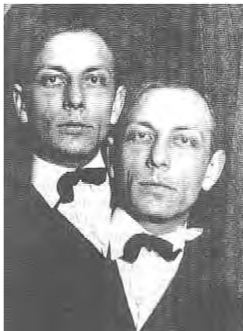
Foto de Henri Michaux, c. 1924

«La droga coge por sorpresa, descubre, desenmascara las operaciones mentales, poniendo conciencia donde no había ninguna, y paralelamente quitándola allí donde siempre la había habido [...]» 1