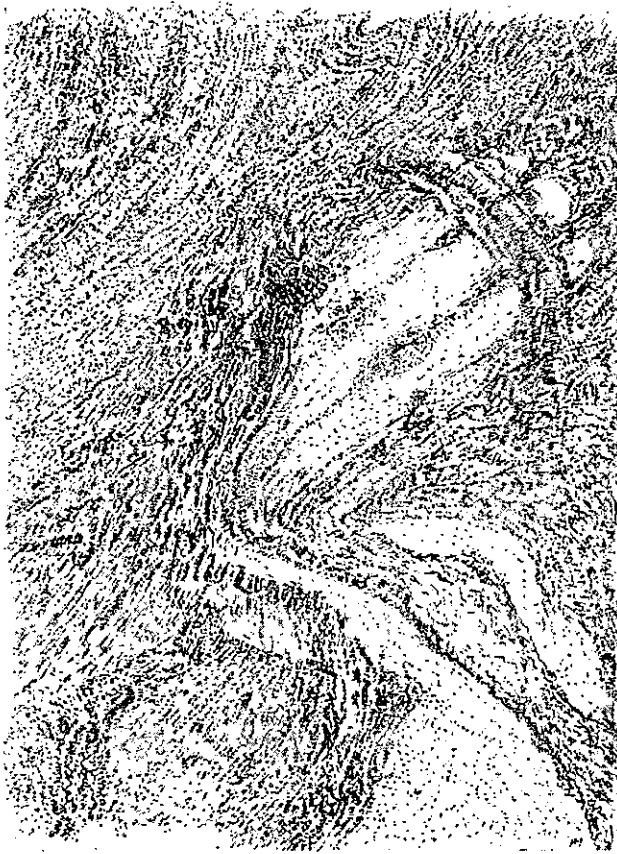
Michaux, dibujo postmescalínico, c. 1969. Tinta china y lápiz de color sobre papel. 24 x 32 cm.

gía, son más bien de reagregación. Se acabó la química que interviene a contracorriente en procesos rompedores y aniquiladores en la máquina del espíritu. Se acabó el voltaje atroz.